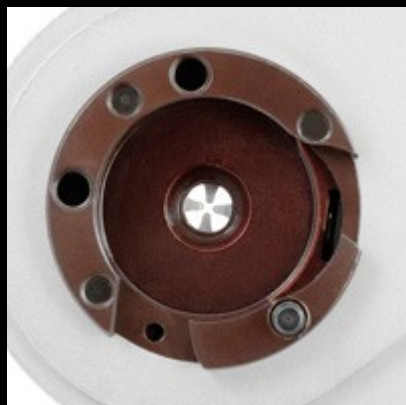
Adapterring für Positionierer nach MIL 22520/1-01 sowie für Rennsteig-Kontaktaufnahmen mit bis zu doppelter Kapazität